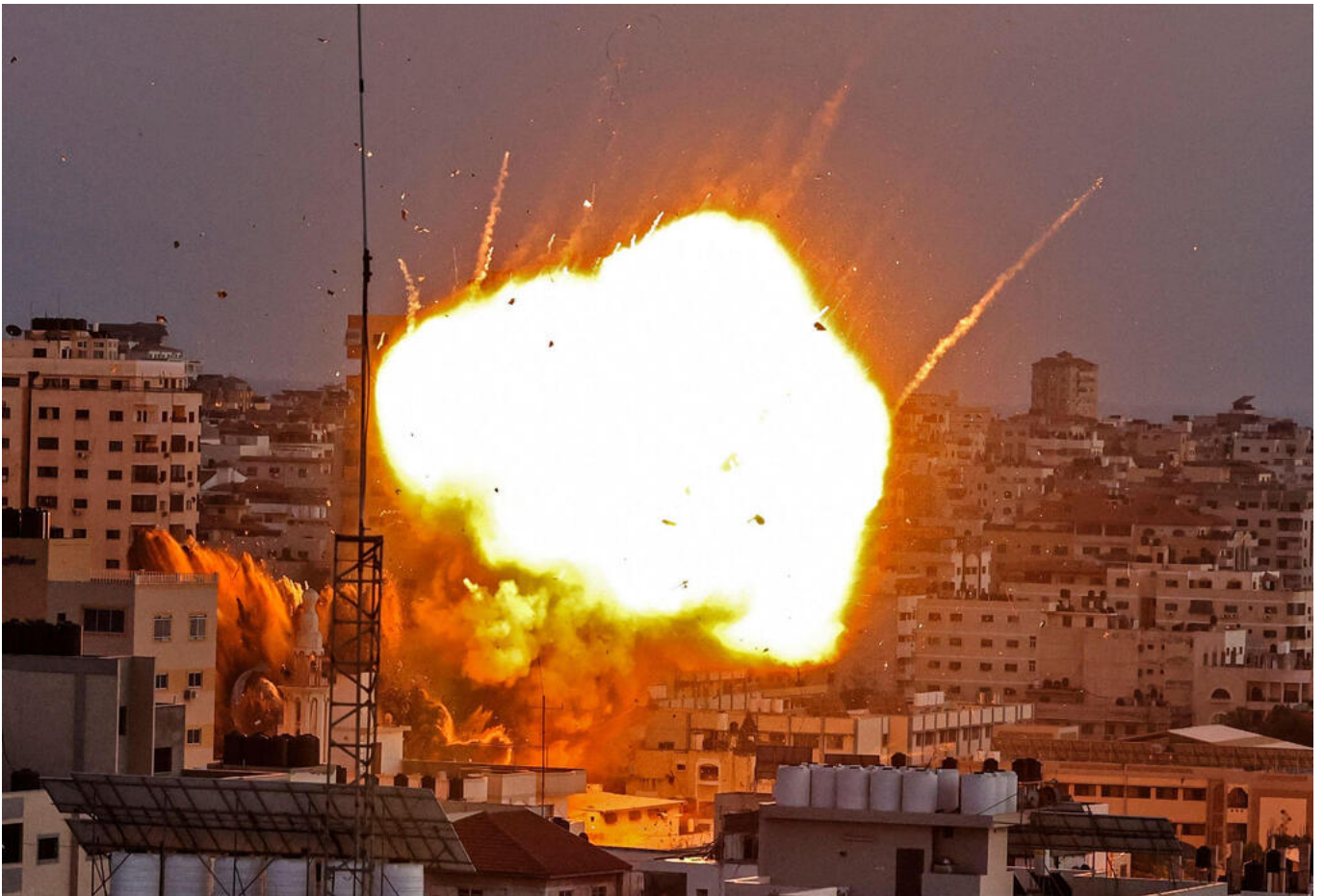
הפצצה של צה"ל בעז