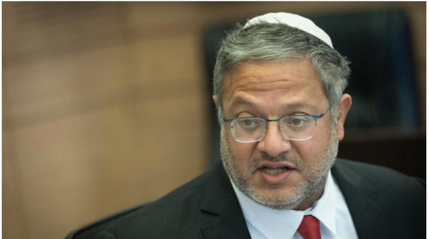
השר איתמר בן גביר